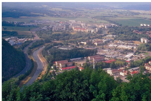
▲ Pohľad z Pustého hradu na Zvolen.