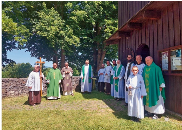
▲ Príprava pred slávnostnou sv. omšou.