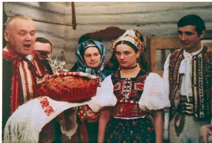
▲ Natáčanie dokumentu Ponická svadba , 1975.

J.P. Aj moje vnúčatá tancujú v DFS Poničan. Podporujem ich v tom a rád si pozriem ich vystúpenia. Mladšej generácii odkazujem, aby si zachovala hrdosť a aby sa hlásila k odkazu svojich predkov. Aby s pýchou ukazovala a pripomínala si zvyky našej krásnej dediny.