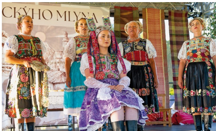
▲ Scéna svadby z tohtoročného festivalu ZPM.