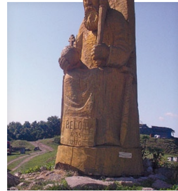
▲ Kráľ Belo IV. sa vrátil na Zvolenský hrad v podobe drevenej sochy.

Po výstavbe Zvolenského zámku v druhej polovici 14. stor. začal starý hrad strácať na význame, hradné komnaty osireli a do mocných múrov sa zahryzol vytrvalý zub času. Využili ho ešte Jiskrovi žoldnier, ktorí prišli brániť nástupnícke práva maloletého Ladislava Pohrobka. V čase tureckého nebezpečenstva tu stála varta, súčasť strážnych veží, z ktorých sledovali pohyb nepriateľa. Do-