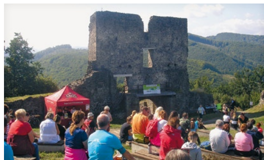
▲ Na zvolenskom Pustom hrade býva živo najmä v prvú septembrovú sobotu počas tradičného turistického výstupu.