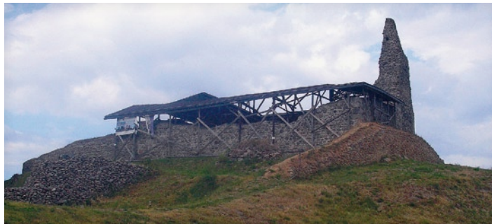
▲ Dolný Hrad.

padná časť Zvolenskej kotliny pomerne husto osídlená, o čom svedčia viaceré odkryté lokality v chotári dnešného Zvolena. Z tých čias pochádza aj poklad bronzových predmetov, na ktorý natrafili partizáni pri kopaní zákopov počas SNP. Len malá časť toho nálezu sa dostala do rúk odborníkov a do múzeí. Miesto sa podarilo objaviť opäť raz až v roku 2001, keď sa podarilo zachrániť viacero cenných predmetov.