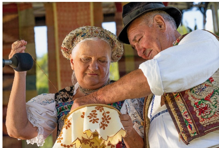
▲ Dvojica protagonistov po 50-tich rokoch.