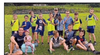
▲ Z tréningu prípravky U11.

tor a jesennú časť súťaže odohrá turnajovým spôsobom s družstvami Slovenskej Ľupče, Lubietovej a Sásovej.