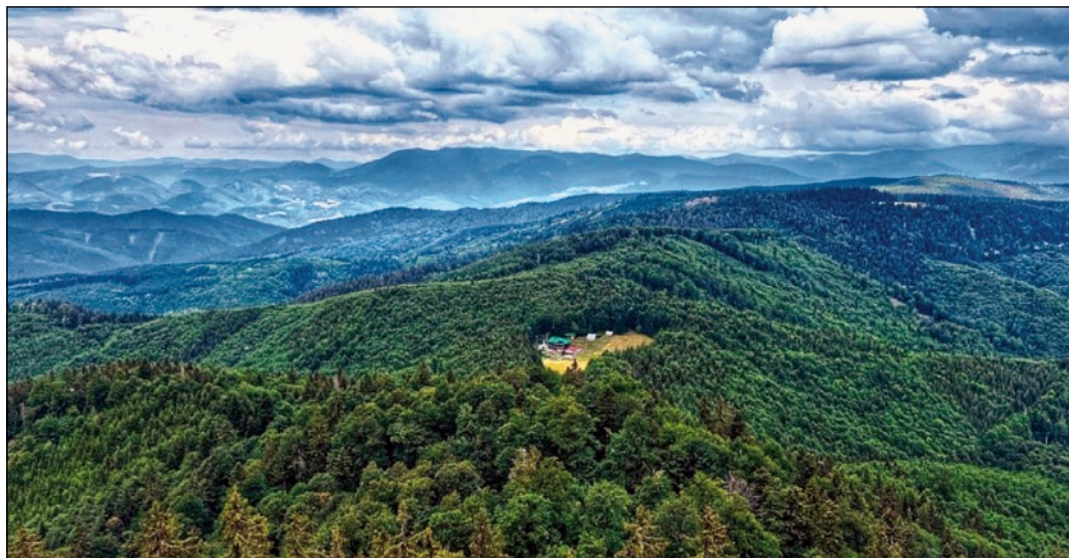
▲ V strede Slovenska.