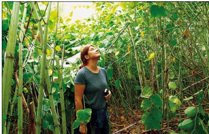
▲ Stav po invázii krídelky, ktorá vytlačí všetky pôvodné druhy.