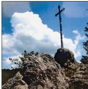
▲ Kríž na Babe.

Zoznam je možné upravovať, to znamená nielen dopĺňať, ale v prípade potreby aj vyradovať. Do evidencie možno zaradiť: hnutelné aj nehnuteľné veci, kombinované diela prírody a človeka, historické udalosti, názvy ulíc a tiež zemepisné a katastrálne názvy, viažuce sa k histórii a osobnostiam obce.