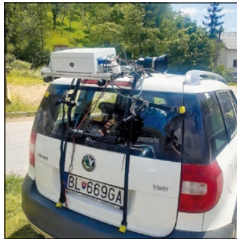
▲ Kamera snímajúca vegetáciu v okolí ciest, fotopasce nočného hmyzu.

Za najdôležitejšie považujem práve to, že ma baví. Nájsť si takú prácu je, myslím, rovnaké šťastie ako nájsť správneho životného partnera. Na práci botanika mám rada, že je rôznorodá, aj keď v podstate má svoj ročný rytmus: od terénneho výskumu naprieč Európou v lete, cez prácu v laboratóriách, spracovanie dát a písanie odborných článkov či projektov, až po konferencie a trochu výučby a vedenie prác študentov biologických smerov. Veľkým privilegiom je tiež, že pracujem v kolektíve, kde je väčšina ľudí múdrejších ako ja, zatiaľ je to skôr motivujúce ako frustrujúce. :)