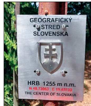
▲ Hrb je stredom Slovenska.

Cez Hrb prechádza červeno značená Rudná magistrála. Smeruje z Detvy cez Polanu a Vepor. Medzi turistami je to obľúbená trasa. Hoci sa naši a nájdu statní "turistickí pretekári", ktorí to zvládnu z doliny Slatiny až k hornému toku Hrona za jeden deň, predsa len je ideálne rozplánovať si prechod Polanou a Veporskými vrchmi na celý víkend. Rudná magistrála schádza od chaty do lesníckej osady Tri vody, v ktorej stojí obnovená historická pamiatka