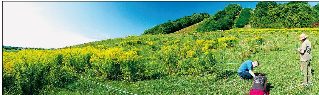
▲ Záber z terénneho výskumu invázných druhov zlatobyle.