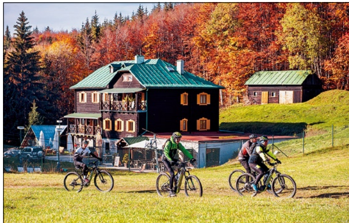
▲ Chata pod Hrbom.

ním Slovenskej akadémie vied a neskôr trnavského Skloplastu, ktorý na mierne sa zvažujúcej lúke postavil lyžiarsky vlek. Napriek tomu tu aj bežný turista našiel občerstvenie