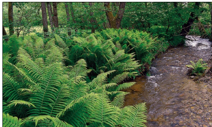
▲ Prírodný brehový porast s jelsou.

Možno ste si všimli, že sa v našom okolí vo veľkom vyskytujú rastliny, ktoré si z detstva nepamätáme, možno len zo záhrad našich babičiek. Mnohé z týchto druhov sú nepôvodnými druhmi, ktoré na území Slovenska pôvodne nerástli a boli k nám dovezené z iných krajín či kontinentov ako okrasné, medonosné alebo len náhodou spolu s osivom či iným tovarom. Inváziám sa takýto druh stáva vtedy, keď sa začne rýchlo šíriť a negatívne ovplyvňovať populácie našich pôvodných druhov a pôvodné ekosystémy. To sa zväčša deje preto, že majú prirodzene veľkú schopnosť reprodukcie (veľa semien, šírenie podzemkami a pod.), a zároveň v novom prostredí nemajú prirodzených nepriateľov, čo im dáva veľkú výhodu oproti domácim druhom. Nielen ich zavlečenie, ale aj šírenie je väčšinou spojené s činnosťou človeka, ktorý im nevedomky „prichystá“ vhodné podmienky (opustené polia, odlesnenie a úpravy vodných tokov) a svojou činnosťou ich roznáša po krajine (prevoz zeminy so semenami, doprava, ale aj úmyselné vysádzanie). Výsledkom sú často husté porasty týchto druhov, ktoré potláčajú či úplne ničia naše pôvodné ekosystémy a zákonite znižujú druhovú pestrosť prírody. Za všetky spomeniem severoamerickú zlatobylú kanadskú a obrovskú, ktoré invadujú okraje ciest (aj hore ▶