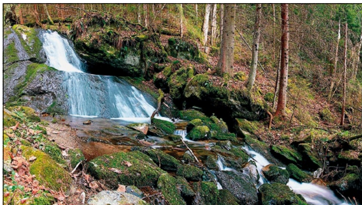
▲ Predajnianske vodopády.

Dominantou východného obzoru nášho kraja je tiahly chrbát Ľubietovského Vepra. Jeho názov nie je náhodný. Hrebeň, ktorý vybieha na sever z kaldery Polány, pripomína chrbát statného diviaka. Najvyšším bodom je samotný Vepor (1 277,2 m n. m.), ale najnavštevovanejším je jeho bralnaté zakončenie hrebeňa - vrch Hrb (1 254,7 m n. m.). Za vhodného počasia, aké prinášajú najmä jesenné dni, sa z Hrbu otvára skvelá panoráma stredného Slovenska. Pri pohľade na východ sa vyníma dvojča Ľubietovského Vepra – Klenovský Vepor, na západnom obzore dohliadneme až na Sitno a Vtáčnik. Keď prejdeme očami lesnatým chrbtom Kremnických vrchov, zastavíme sa na veľkofatranskej Krížnej