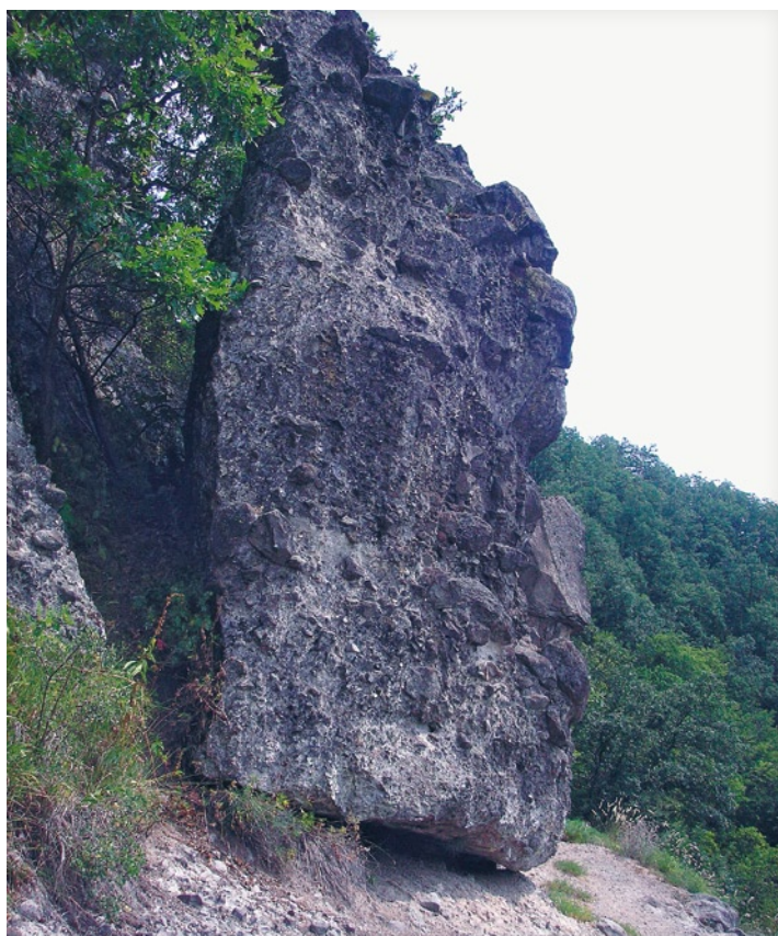
▲ Na prechádzke v rezervácii Boky padnú do oka nevšedné skalné útvary.