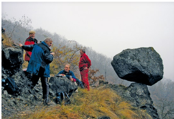
▲ Zastávka pri Čertovej skale.

jar a v lete, keď sa rezervácia Boky, v ktorej sa Čertova skala nachádza, rozžiari nielen zelenou, ale aj inými farbami, keď sa vzduchom nesú lahodné vône i pestrá zmes hlasov prírody.