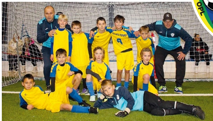
▲ Zábery z medzinárodného turnaja U10 v Korní.

V mládežníckych súťažiach máme v tomto ročníku zaradené až 4 mužstvá. Družstvo dorastu, mladších žiakov a dve družstvá prípravky do 11 a do 9 rokov. Družstvo dorastu